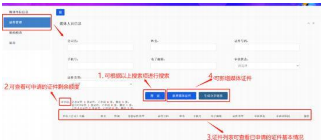
(媒体单位基本信息)